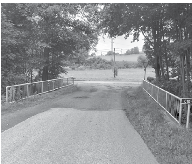
Zábradlí - Most u koupaliště