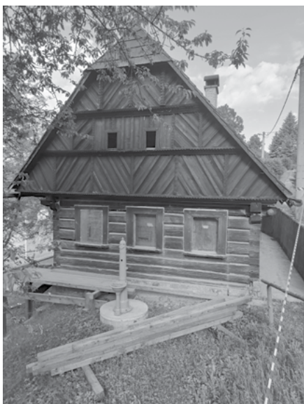
Zahájení opravy Krsmol