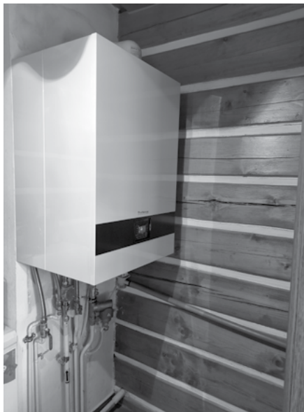
Nový kotel v knihovně