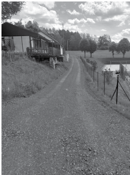
Oprava cesty nad Sokolákem