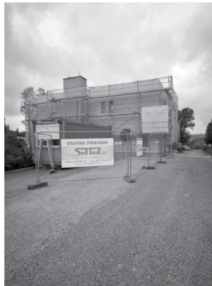
MŠ - 2. etapa