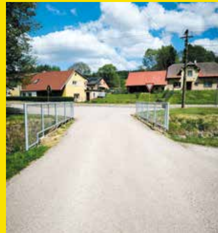
zábradlí U Splavu