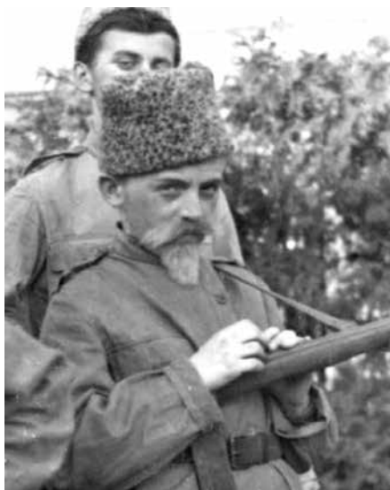
V divadelním představení 3. ročníku měšťanské školy Stará Paka v roli partyzána, 1952