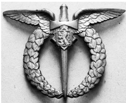
PRESIDENT ČESKOSLOVENSKÉ REPUBLIKY