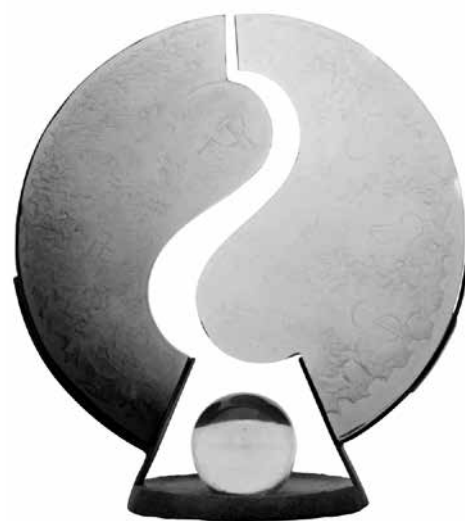
Jiří Ryba: Milenium, skleněná plastika

Ve dvacátém století bylo plno hrůzy ať v tom novém přeletí láska, cit a múzy