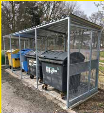
přístřešek na kontejnery Revoluční Stará Paka