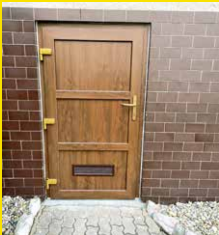
dveře Hartlova ulice