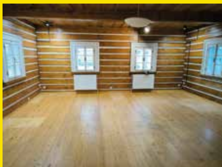
oprava knihovny - podlaha, místnost