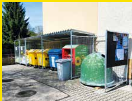
přístřešek na kontejnery Brdo