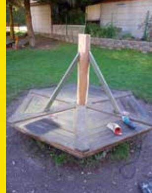
oprava hřiště u Sokolovny

PODHORAN - čtvrtletník OÚ Stará Paka. Redakce – Hana Hylmarová, Mgr. Jitka Krausová, a Jan Herber. Redakční uzávěrka: 20. 5. 2024. Vychází 4x ročně. Náklad: 400 ks. Adresa redakce: Podhoran, OÚ Stará Paka. Tisk: JOMA design - Příspěvky zasílejte na knihovna@starapaka.cz.