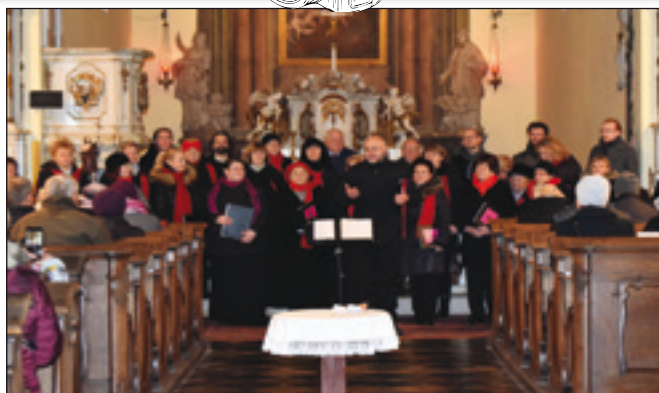
Koncert v kostele