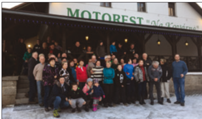
Tradiční roškopovský vánoční vejšlap