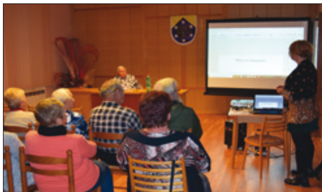
Posezení nad kronikou