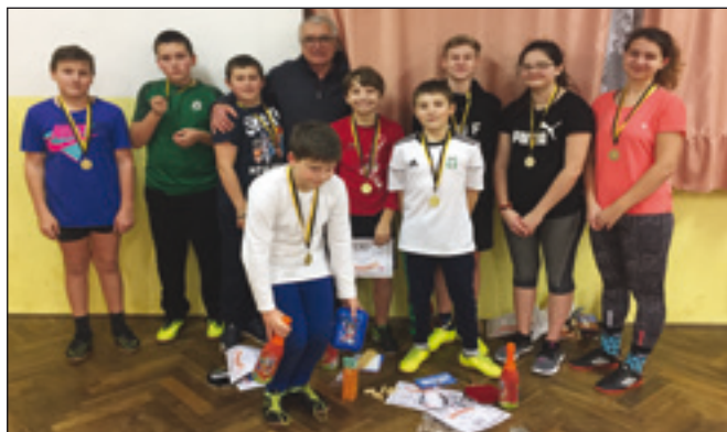
Z turnaje stolních tenistů