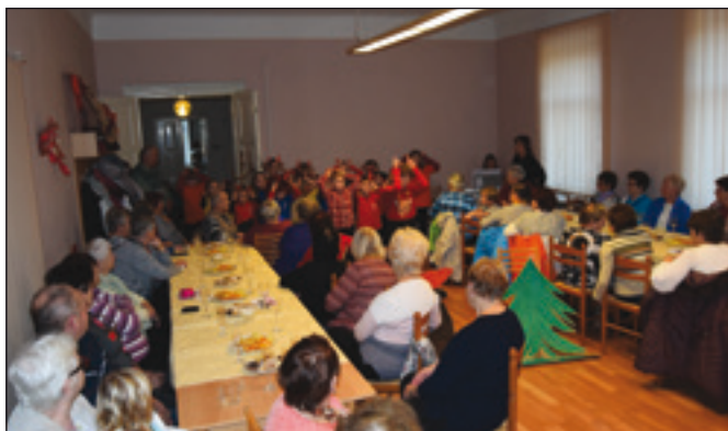
Posezení pro seniory