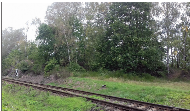
Malebné oklí naší obce