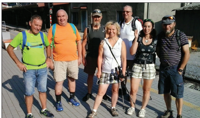
Účastníci tradičního Vejšlapu