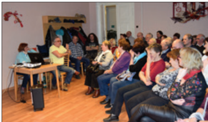
Cestopisná přednáška - Transsibiřskou magistrálou