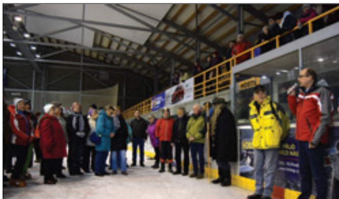
Senioři na zimním stadionu