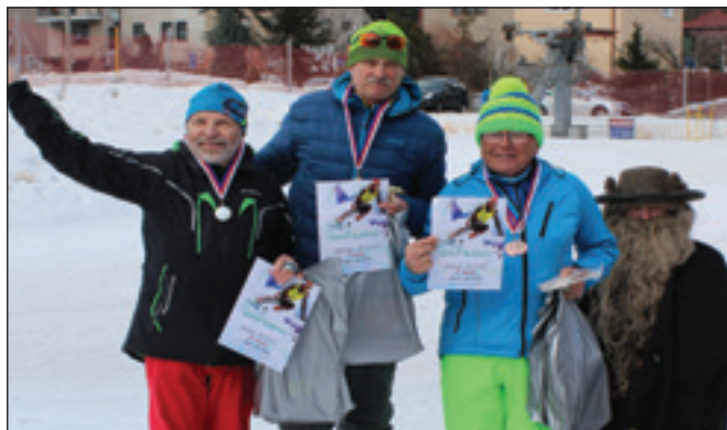
Vítězové lyžařských závodů