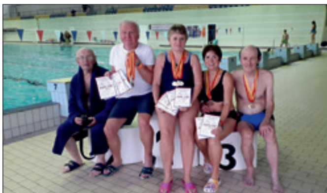
Senioři na plaveckých závodech