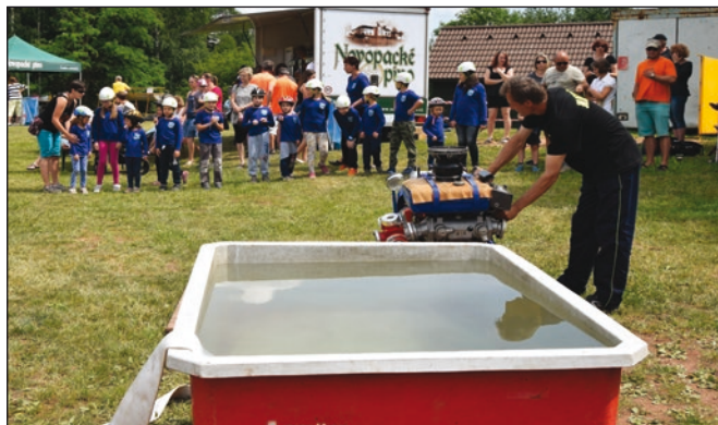
Součástí ukázky byl i útok v provedení nejmenších hasičů