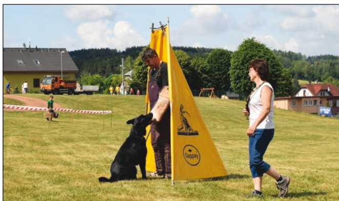
Kynologický klub ve Starém Pace - vyštěkáni v maketě