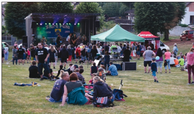
K poslechu hrálo několik kapel...