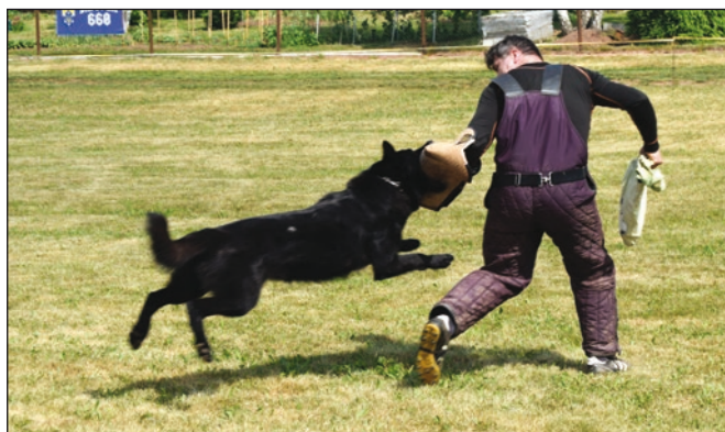
Zadržení pachatele - figurant musí ukázat fyzickou připravenost...