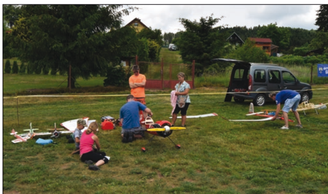
Členové modelářského klubu se připravují na svoji ukázkou...