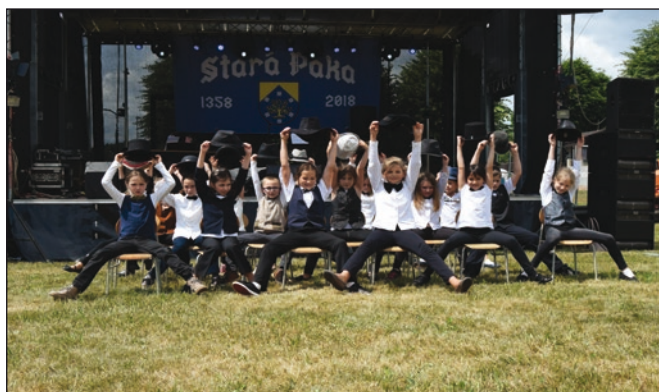
Vystoupení dětí z Masarykovy základní školy