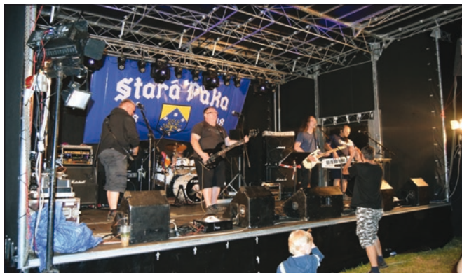
A tady detailní pohled na skupinu...