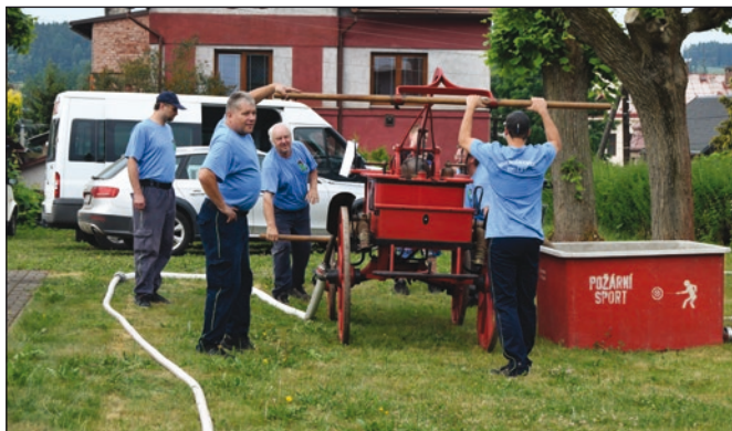
V rámci oslav ve Staré Pace se představili dobrovolní hasiči