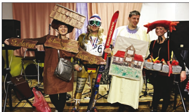
Maškarní bál - Nejoblíbenější maskou se stala Staropacká bouda s rozcestníkem a ohništěm.