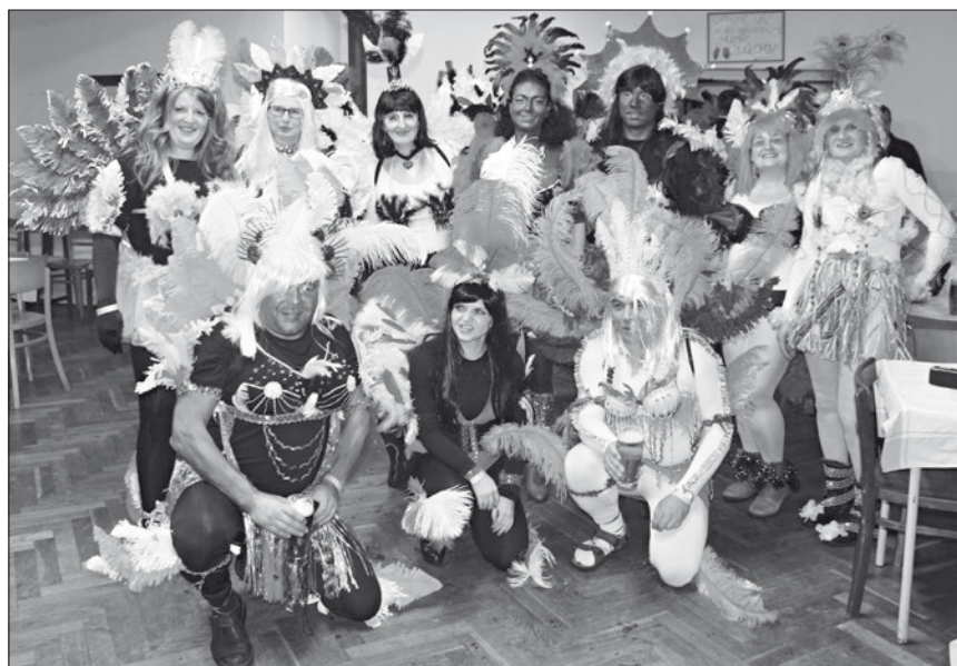
Ještě společné foto brazilského karnevalu a taneční rej může začít.