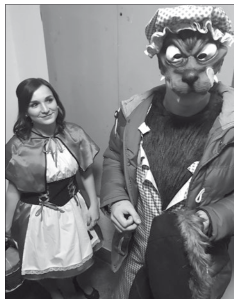
Červená Karkulka se zlým vlkem zatím marně hledají svoji babičku.