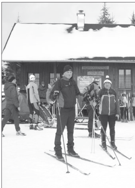
Před Knajpou. Počasí nám zatím přeje.

Společné foto u Staropacké boudy před startem do druhého dne Přejezdu Jizerských hor a Krkonoš 2018.