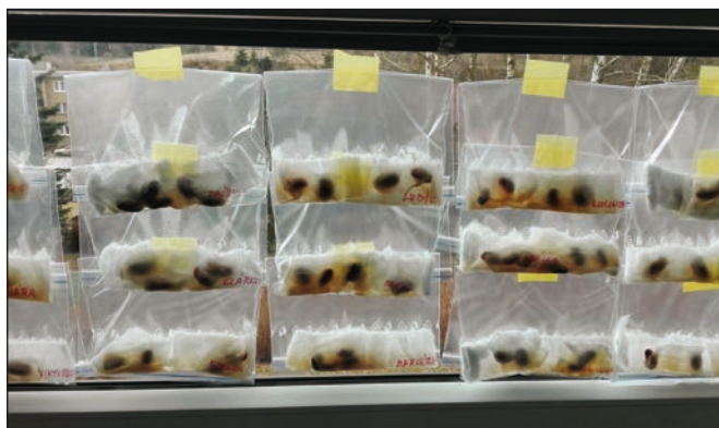
Umístění na okně dodalo semínkům teplo a světlo.