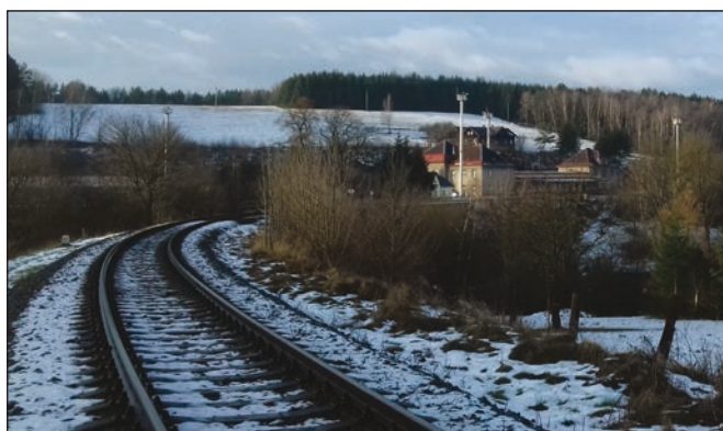
Předjaři ve Staré Pace.