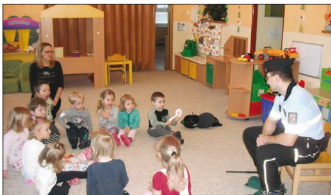
Rodiče přibližují dětem svá povolání...