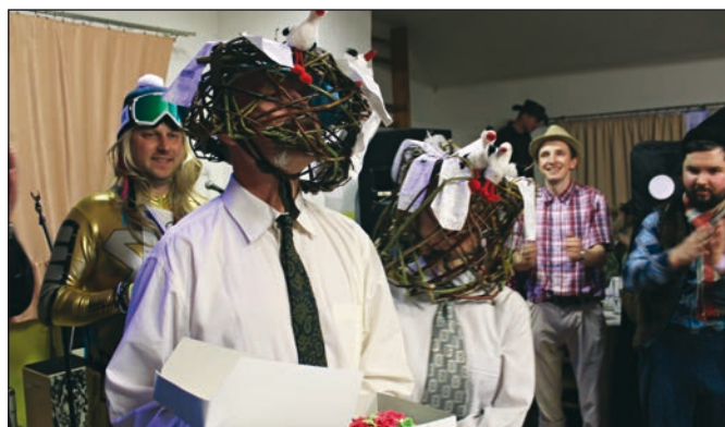
Maškarní bál - Čapí hnízda.