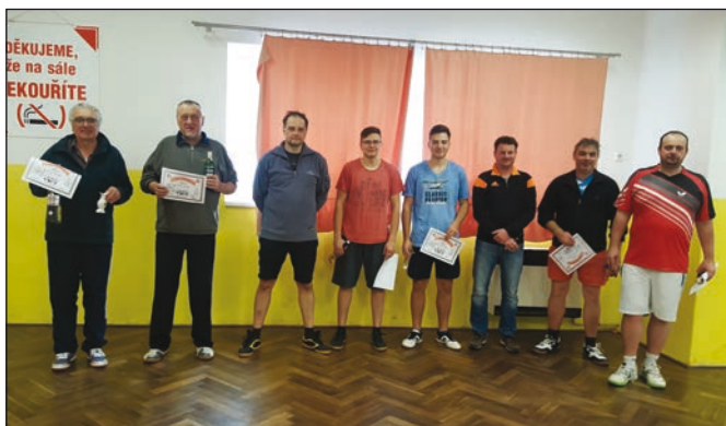
Silvestrovský turnaj ve stolním tenise