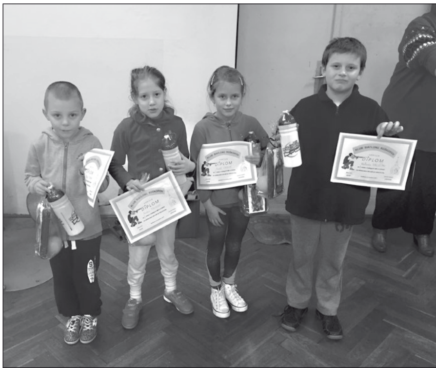
Závody ve střelbě ze vzduchovky, vítězové