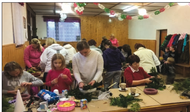
Výroba věnečků v Ústí