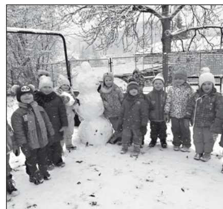
Děti ve školce