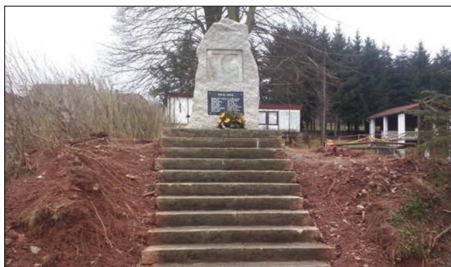
Stavba pomníku padlým