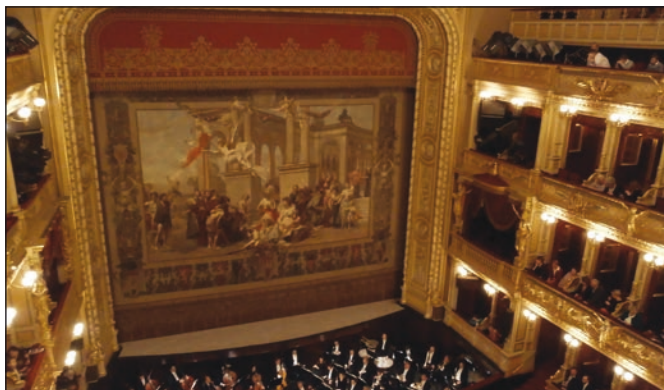
Návštěva Národního divadla