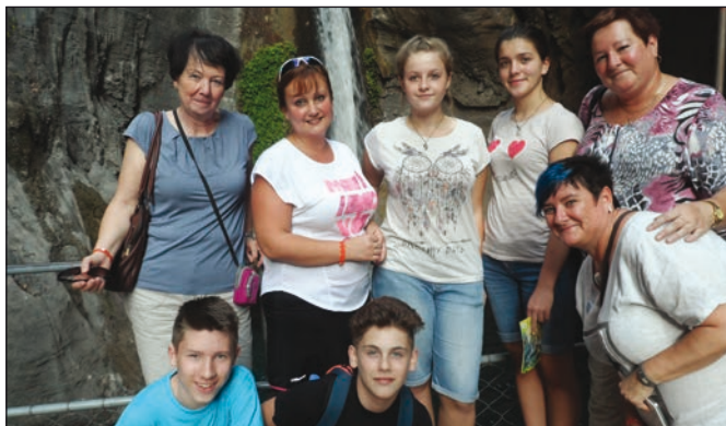
Mezinárodní projekt Erasmus - Setkání v Turecku