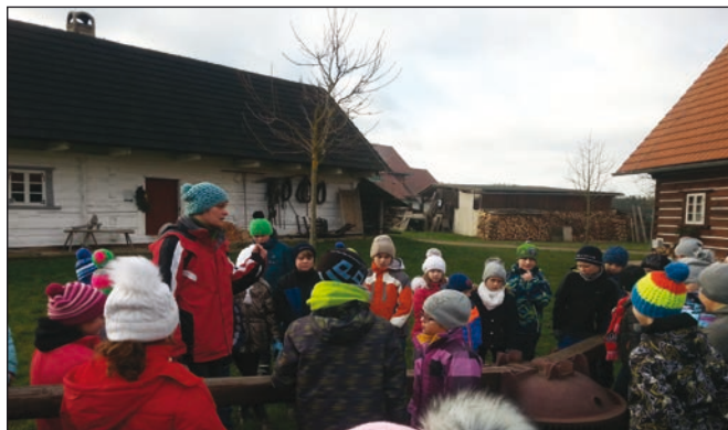
Předvánoční výlet 1. stupně do Krňovic