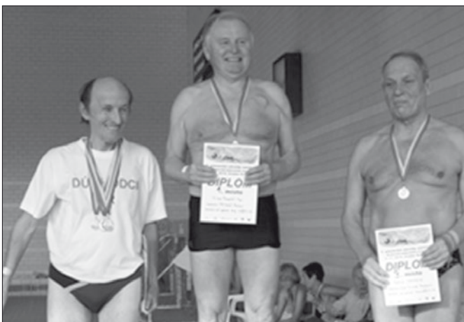
Snímek z vyhlášení výsledků na 50 m volný způsob.