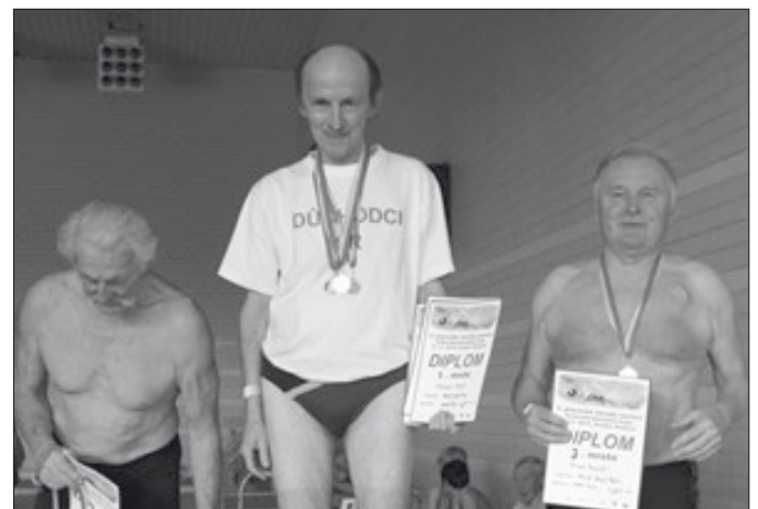
Snímek z vyhlášení výsledků na 50 m znak.