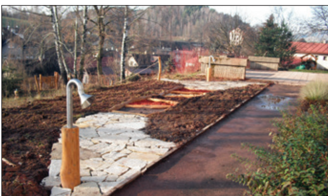
Zahrada po dokončení