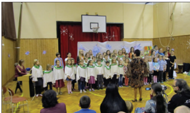
Z vánočního vystoupení