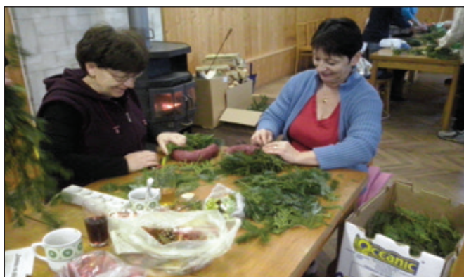
Ve vánoční atmosféře nám šla práce od ruky