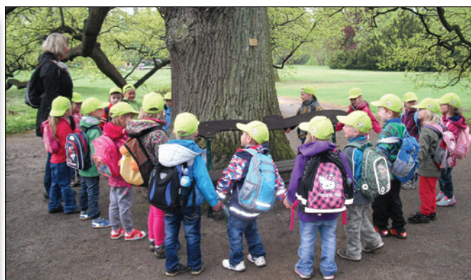
Výlet na Sychrov