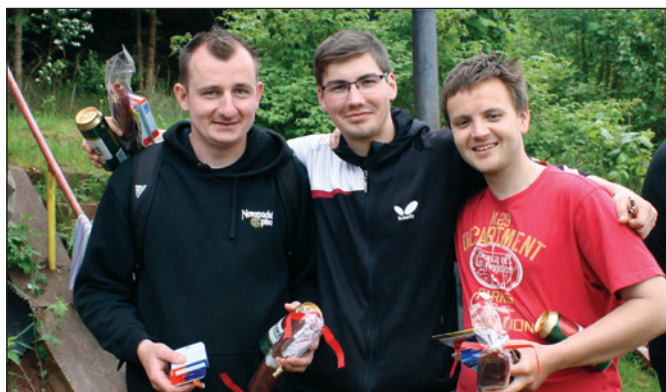
Nohejbal 2015 - vítězové