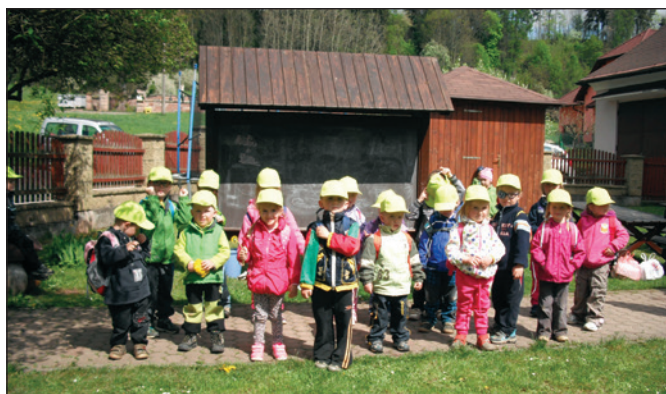
Výlet Sedmikrásek do mateřské školy v Levínské Olešnici