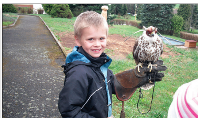
Ukázka výcviku sokolnických dravců