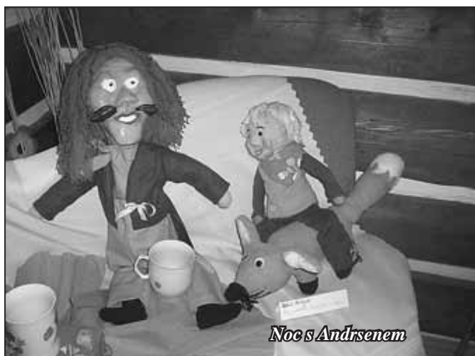
Noc s Andersenem