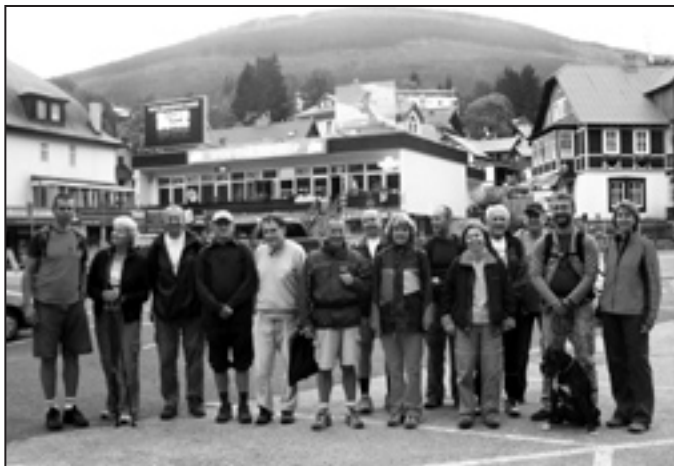
Za pořádající oddíl lyžování TJ Sokol Stará Paka: B. Nydrle

Čas do odjezdu vlaku jsme pak ještě vyplnili tradičním hodnocením celé akce v restauraci Kufr před vrchlabským nádražím.