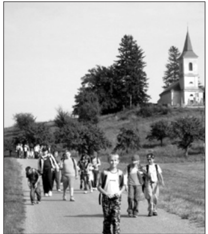
Fotografie k článku o výletu na Byšičky od Jany Bartošové.