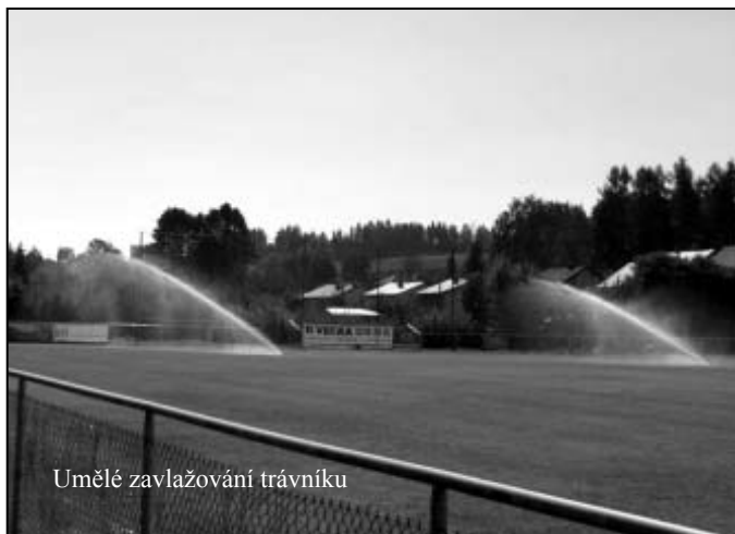
Umělé zavlažování trávníku