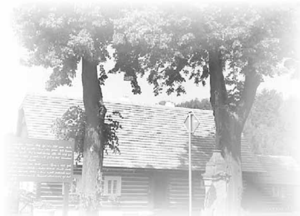
Stará Paka 8. 9. 2008